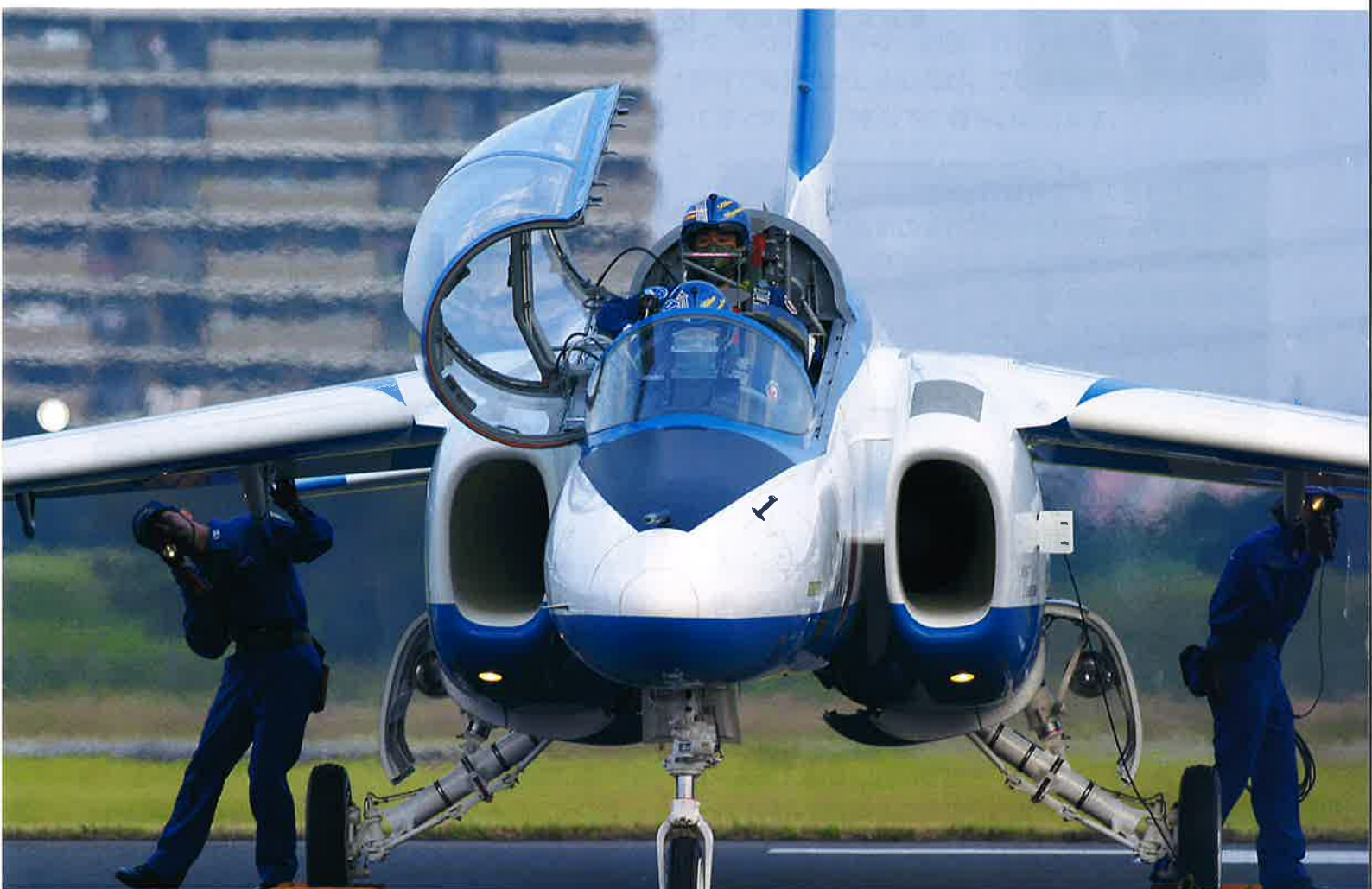
ブルーインパルス 飛行前点検：入間基地航空祭（埼玉県）