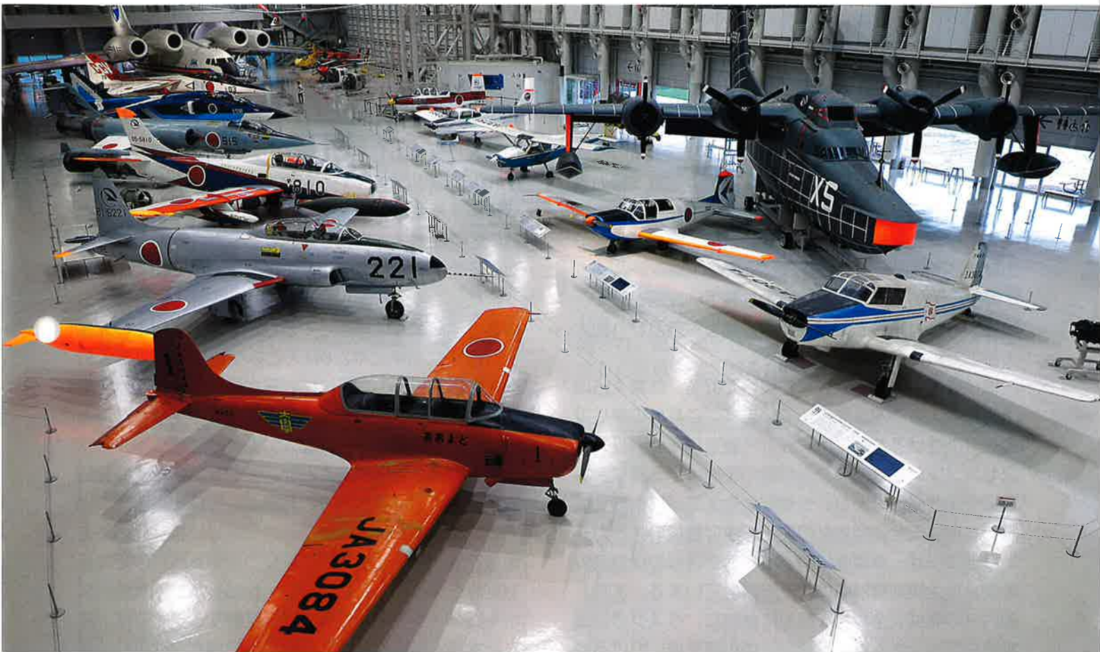
岐阜かかみがはら航空宇宙博物館(岐阜県各務原市)

この博物館は、現存する日本最古の飛行場である航空自衛隊岐阜基地に隣接し、各務原飛行場開設100年にあたる2017年にリニューアルした。屋外展示5機、屋内展示面積9400平方メートルに29機が並ぶ。世界で唯一、戦時中の姿をとどめる旧陸軍三式戦闘機「飛燕」の機体などが展示されている。