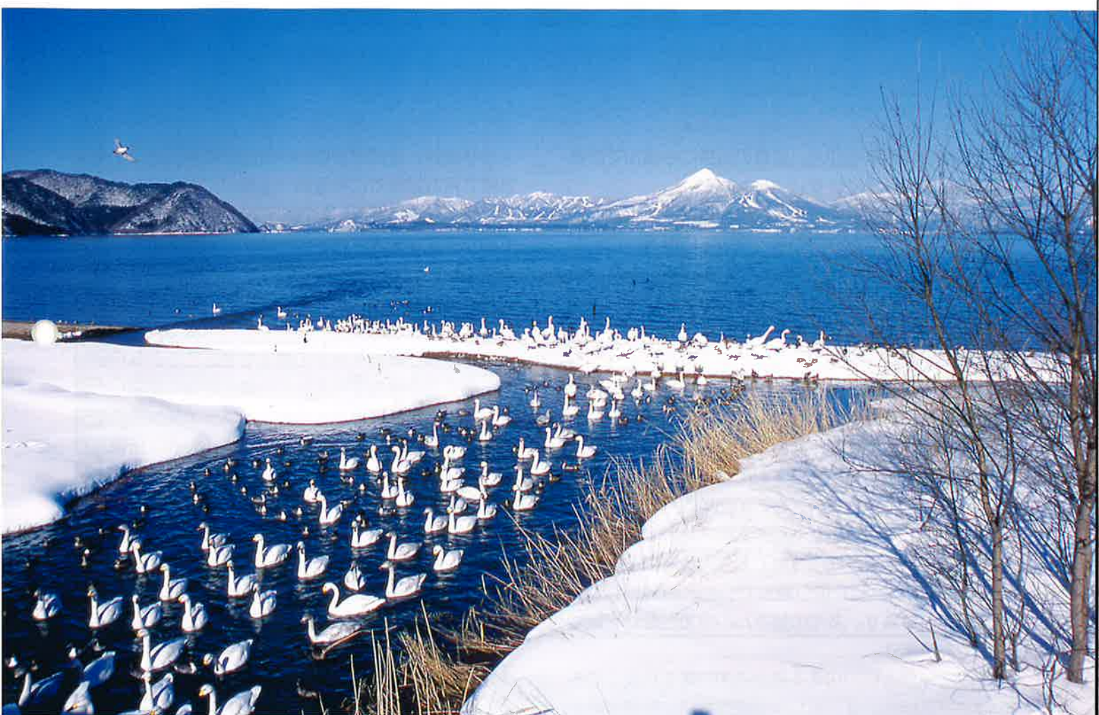
猪苗代湖の白鳥